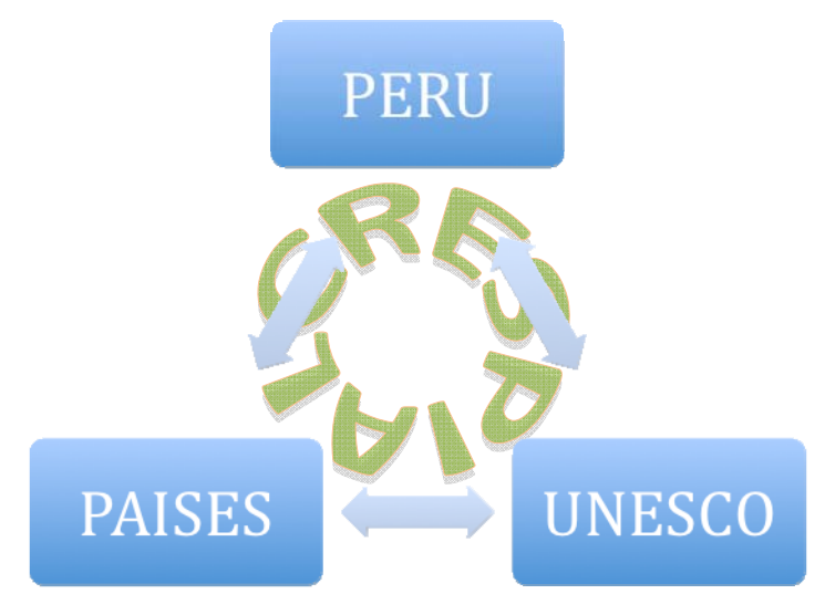
Ilustración 1: Ejes de CRESPIAL

CRESPIAL, si bien es un acuerdo entre Perú y UNESCO, funciona como resultado de la colaboración de tres ejes, y no podría continuar ejerciendo sus funciones de faltar uno de ellos.