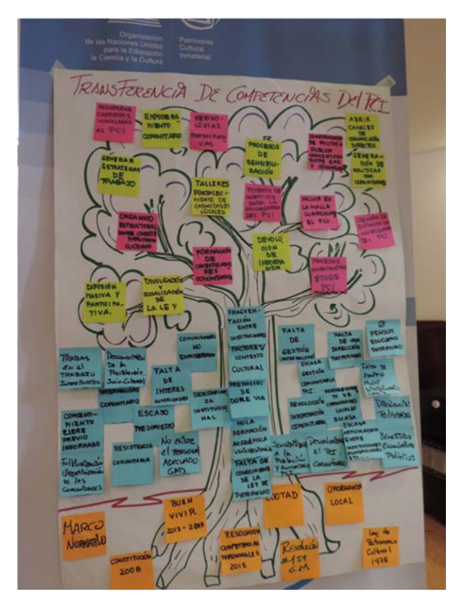
Methodology used in the Riobamba workshop (tree of problems)