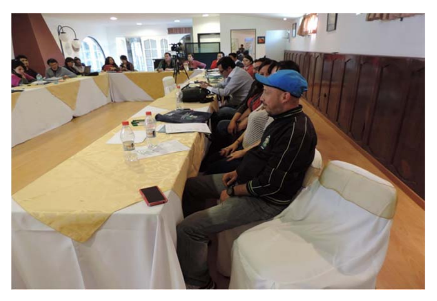
26 Participants of which 45,5% were women