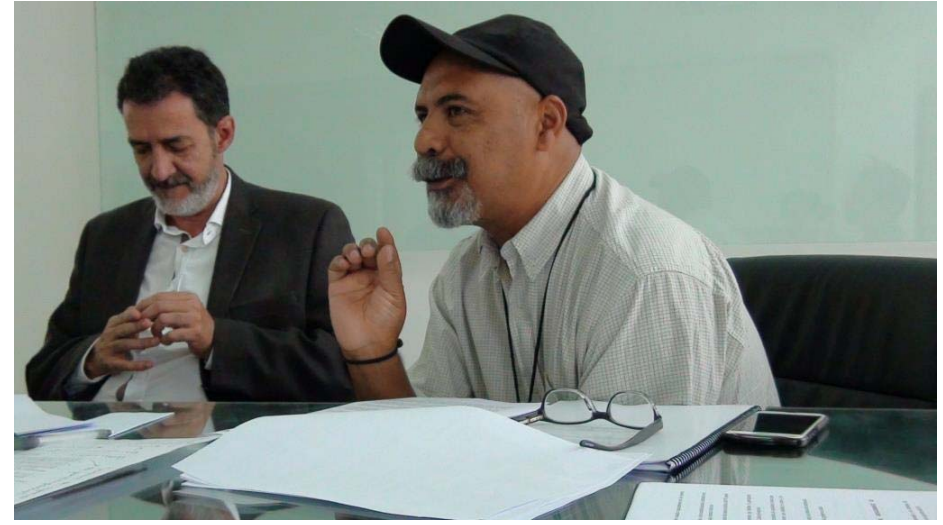
Working table about ICH and participation