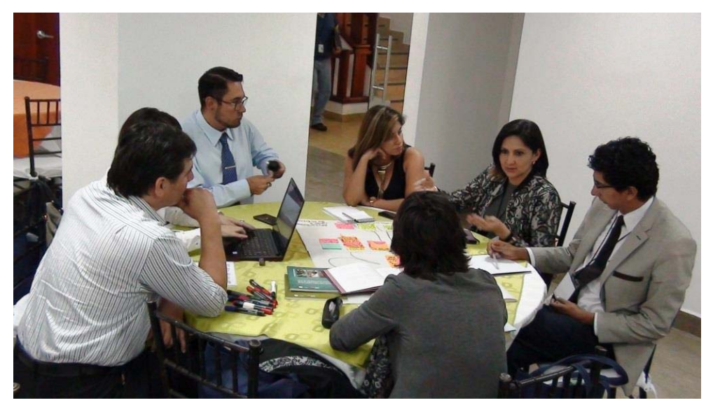
Working table about ICH and risk management