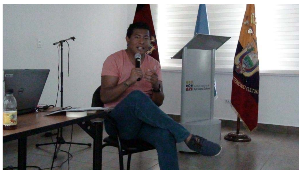
Presentation about intellectual property in Ecuador by the government representative.