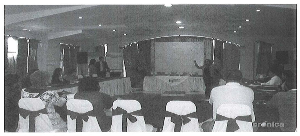
Representantes de municipios asisten al encuentro.