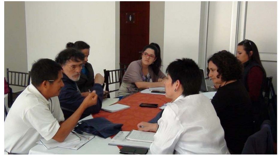
Working table about ICH and Education