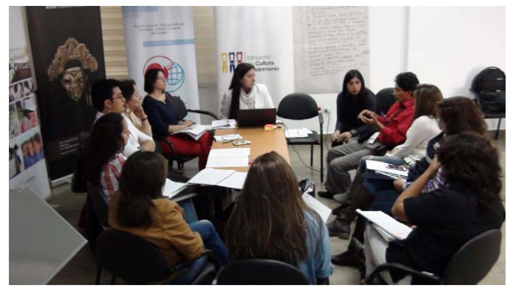
Working table about ICH and local government management