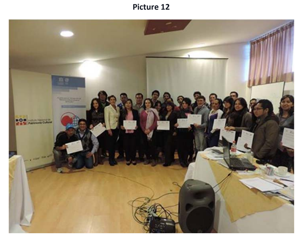
Delivery of certificates to participants in Riobamba.