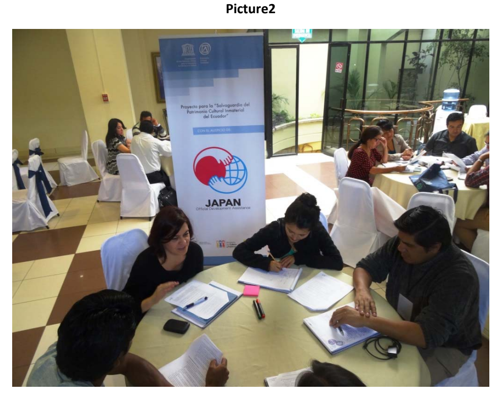
26 Participants in Loja Workshop of which 42, 3% were women