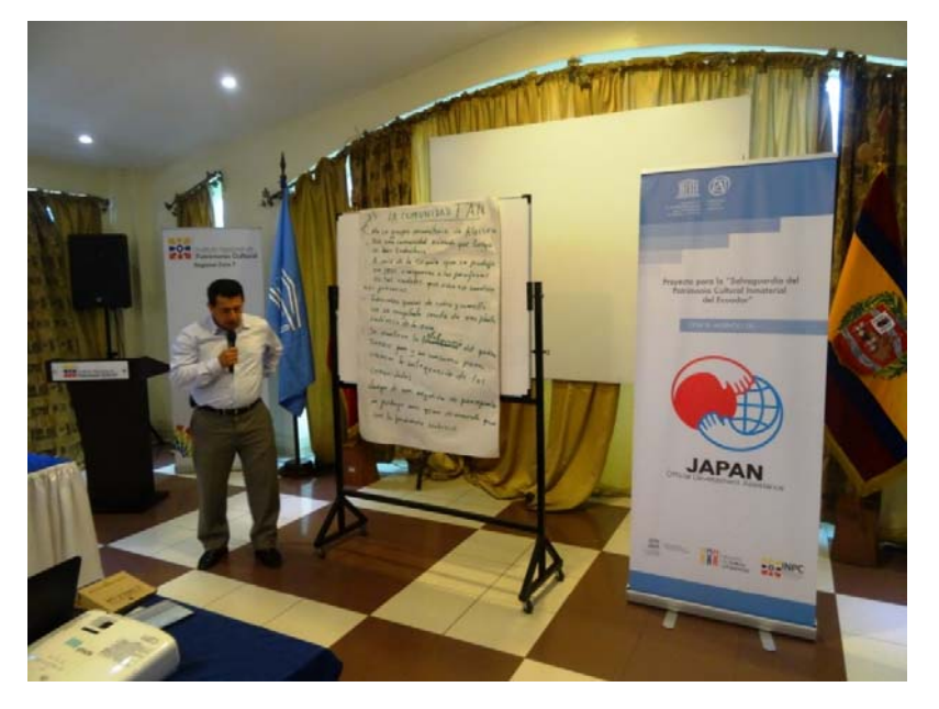
Ángel Ríos, Deputy Mayor of the canton Olmedo, Loja.