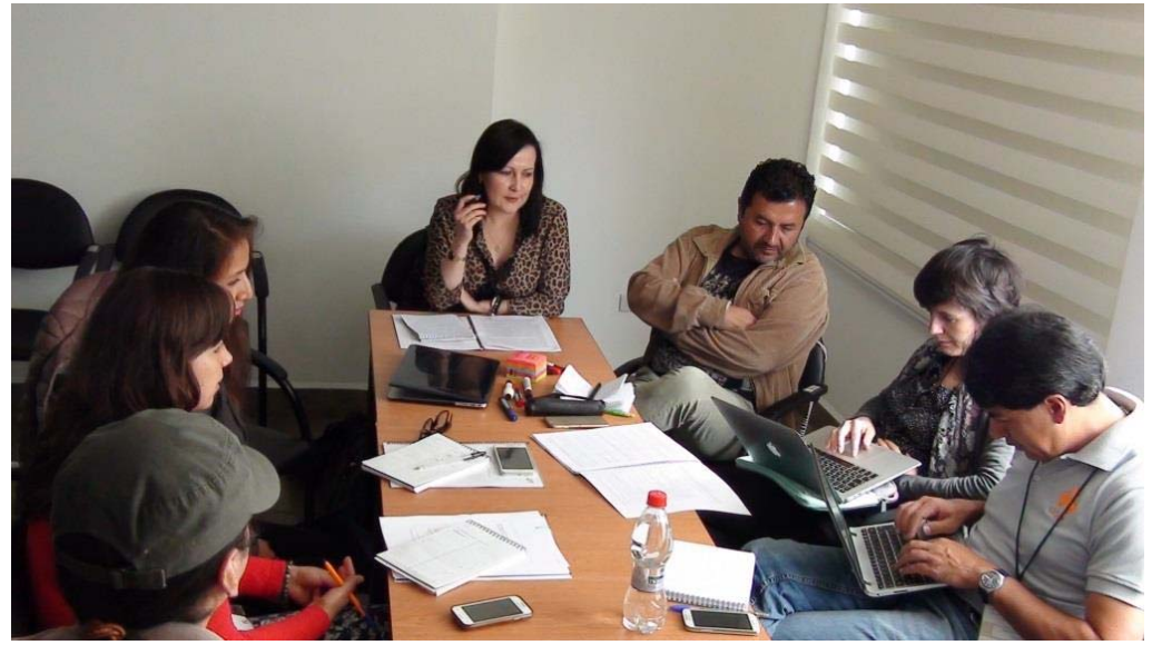
Working table about ICH and sustainable development