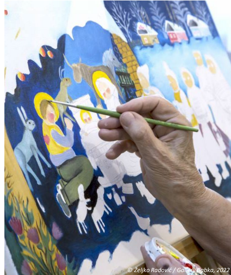
© Željko Radović / Gallery Babka, 2022