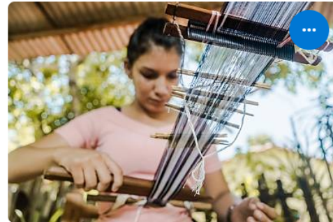
Artisan weaving the guard (II) En savoir plus sur l'élément

Une session d'information et d'échange se tiendra au Siège de l'UNESCO, à Paris, le 1 octobre 2024 (après-midi) pour présenter les méthodes de travail du Comité ainsi que des informations pratiques concernant cette session. Cette session d'information et d'échange sera également diffusée en direct sur la page web du 19.COM.