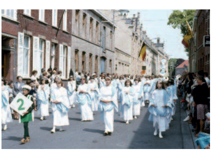
In Poperinge werken ze met een werkgroepensysteem om de werklast van de vrijwilligers te verminderen. [LECA]

De organisatie van de Maria Ommegang in Poperinge kwam lange tijd volledig op de schouders van slechts enkele vrijwilligers terecht. Omdat dat kleine groepje alle taken en verantwoordelijkheden op zich nam, was de werklast erg groot. Aan het begin van de jaren 1990 werd daarom beslist de samenstelling van het organiserend comité aan te passen en een werkgroepensysteem in te voeren. Sindsdien worden de verschillende aspecten van de stoet (kledij, publiciteit, rekrutering, financiën, grime, muziek, dieren, wagens, regie...) door aparte diensten geregeld. Voor ieder aspect is een verantwoordelijke aangeduid, die zelf op zoek gaat naar mensen die hem of haar op die dienst willen helpen. Binnen grote diensten, zoals kledij of publiciteit, worden de verschillende taken over meerdere werkgroepen verdeeld. Iedere dienstverantwoordelijke heeft ook zitting in het organiserend comité, dat één keer per maand samenkomt. Dat comité staat erop dat elke verantwoordelijke een assistent heeft. Als de verantwoordelijke om