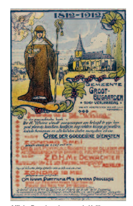
Affiche Broederschap van de Heilig Wivina, Groot-Bijgaarden 1912.

waar je ze op de harde schijf opslaat. Door regelmatig backups te maken, voorkom je dat de documenten verloren gaan. Zo'n back-up sla je op een andere computer of op een externe harde schijf op. Ook voor digitaal archief geldt natuurlijk dat je snel moet kunnen vinden wat je zoekt. Een goede mappenstructuur en korte en duidelijke map- en documentnamen zijn dan handig. Er wordt aangeraden om alleen de tekens a-z en 0-9 te gebruiken en om spaties te vervangen door een liggend streepje. Een documentnaam kan er dan bijvoorbeeld zo uitzien: 20130501_verslag.doc of programma_ontwerp_versie1.doc. Door met courante bestandsformaten te werken, voorkom je dat je documenten niet meer kan openen. Je doet er sowieso goed aan om dat geregeld na te gaan. E-mails die je wil bewaren, sla je vanuit Outlook op in de archiefmappen. Als bestandsformaat kies je 'Outlook-berichtindeling - Unicode' (.msg). Wil je digitale foto's aan het archief toevoegen, kies dan voor een JPEG- of TIFF-formaat. Voor iedere fotoreeks maak je een aparte map aan. In de mapnaam vermeld je de activiteit en datum. Om meer te lezen over digitaal archief, surf je naar www.archiefbank.be (rubrieken 'Helemaal digitaal' en 'Meer leesvoer').