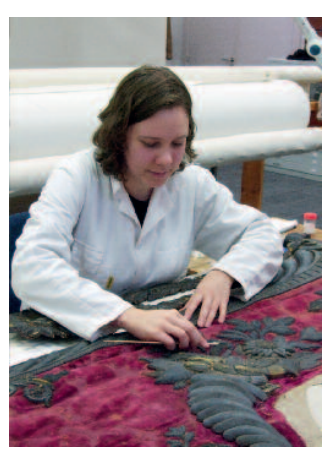
De Sint-Pauluskerk in Antwerpen werkte samen met de Artesis Hogeschool om het processievaandel van de Heilige Lucia te restaureren.

masterstudent conservatie/restauratie schilderkunst. De hele procedure werd nauwgezet begeleid door een aantal docenten. Ook de opdrachtgever zelf werd voortdurend bij de restauratie betrokken. Aanvullend werd ook een masterscriptie opgesteld met daarin een onderzoeksschema voor de overige vaandels. Bij het vrijwaren van de vaandels voor de toekomst wordt deze scriptie een belangrijk hulpmiddel om te begrijpen hoe fragiel de materialen zijn en op welke manier ermee omgegaan kan worden. Niet alleen voor de restauratie zelf, maar ook voor de financiering ervan kon op een positieve manier samengewerkt worden. Een deel van het bedrag werd door de Provincie Antwerpen gesubsidieerd; de Sint-Paulusvrienden en de Broederschap stonden in voor de overige kosten.