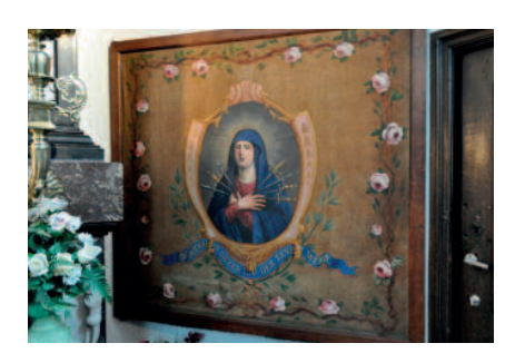
Het historisch vaandel van de Broederschap van Onze-Lieve-Vrouw van Zeven Weeën wordt ingelijst tentoongesteld in de kapel. [Martine Creve]

ingelijst te bewaren, stelden de processieorganisatoren ze veilig voor de toekomst. Op die manier blijft dat roerend erfgoed ook voor de volgende generaties bewaard.