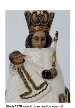
Onze-Lieve-Vrouw in het Hammekenbeeld gebruikt voor de ommegang. [Maria door Vlaanderen gedragen]

Het meedragen van waardevolle oude heiligenbeelden in een processie brengt een aantal risico's met zich mee. Bij een valpartij of botsing kan een beeld bijvoorbeeld ernstige schade oplopen. Ook regen, wind of zonlicht werken rechtstreeks op een processiebeeld in en kunnen voor blijvende beschadigingen zorgen. Om beelden tegen dergelijke invloeden te beschermen, kunnen organisatoren ervoor kiezen om het oorspronkelijke beeld in de processie te vervangen door een kopie. Zo'n beeld wordt in erfgoedtermen een replica genoemd. Onder meer in Zemst wordt een vervangend beeld meegenomen. Het originele houten en gepolychromeerde beeld van Onze-Lieve-Vrouw in het Hammeken dateert wellicht van het einde van de vijftiende of het begin van de zestiende eeuw. De legende van het miraculeuze beeld in Zemst gaat terug tot rond 1200. Vissers zouden het toen gevonden hebben op de plek waar ze met hun schip vastliepen. Om het schip weer vlot te trekken, laadden ze het met de hulp van buurtbewoners af. Dat baatte