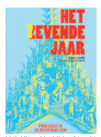
In het boek Het zevende jaar vind je de resultaten van het onderzoeksproject naar zevenjaarlijkse feesten in de Euregio Maas-Rijn.

Sinds 1682 viert Hasselt om de zeven jaar de Virga Jessefeesten. Het absolute hoogtepunt van dat gebeuren is telkens de ommegang met het Virga Jessebeeld door de straten van de stad. De voorbereiding van die feestelijkheden is in handen van het Comité Zevenjaarlijkse Virga Jessefeesten vzw. Vanuit dat comité wordt ook veel aandacht besteed aan het processie-erfeoed. Met het oog op de toekomst wordt immers actief gebouwd aan "een uitgebreide erfgoedgemeenschap, waarin de religieuze essentie behouden blijft". Ook het documentair erfgoed wordt