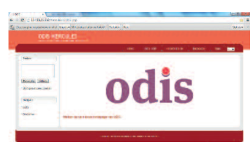
De contextuele databank ODIS biedt een handig instrument om ook jouw processiearchiel te registreren en dus bij onderzoekers bekend te maken. [vzw ODIS]

Op tal van plaatsen in Vlaanderen is de jaarlijkse processie altijd al een belangrijk moment in het leven van de lokale gemeenschap geweest. Het hoeft dan ook niet te verwonderen dat de organisatie van een processie in de praktijk vaak nauw verweven is met de plaatselijke parochiale werking. In parochiearchieven is daardoor een schat aan informatie over processies te vinden. Ook in het bisdom Gent is dat het geval. Het bisdom besteedt veel aandacht aan de zorg voor parochiearchieven. Om daar op een goede manier mee om te gaan, werd zelfs een speciale medewerker aangesteld, die de voorbije jaren al meer dan 120 archieven heeft geïnventariseerd. Sommige daarvan worden lokaal bewaard, andere werden intussen in bewaring gegeven aan een professionele archiefinstelling. Uit de opgemaakte inventarissen blijkt dat in bijna de helft van de parochiearchieven documenten over processies aanwezig zijn. Soms gaat het om niet meer dan één archiefstuk, maar vaak is er heel wat meer informatie beschikbaar, bijvoorbeeld brieven, financiële documenten, stukken over de processieobjecten, programmabrochures, affiches, beeldmateriaal, informatie over de samenstelling en volgorde van de processies... In de toekomst zal alle informatie over de parochiearchieven van het bisdom Gent ontsloten worden via de ODIS-databank.