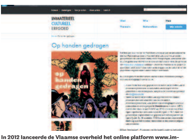
In 2012 lanceerde de Vlaamse overheid het online platform www.immaterieelerfgoed.be.

platform je erfgoedelement inhoudelijk te documenteren. Bij de aanvraag moet verder een weldoordacht erfgoedzorgplan gevoegd worden. Ook op dat vlak heeft de Vlaamse overheid hulp voorzien. Ze subsidieert heel wat cultureelerfgoedorganisaties om mensen te adviseren en te begeleiden. LECA maakt deel uit van dat netwerk en is het expertisecentrum voor feesten, rituelen en sociale praktijken. Processiecomités kunnen er terecht voor tips en hulp om met hun immaterieel cultureel erfgoed om te gaan.