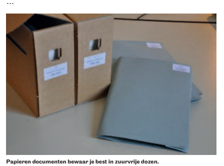
Papieren documenten bewaar je best in zuurvrije dozen.

Doos 3: foto's, 1950-1960 en briefwisseling, 1970-1975.