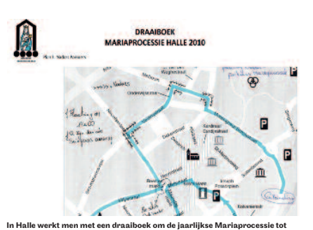
een goed einde te brengen. [Johan Vencken]