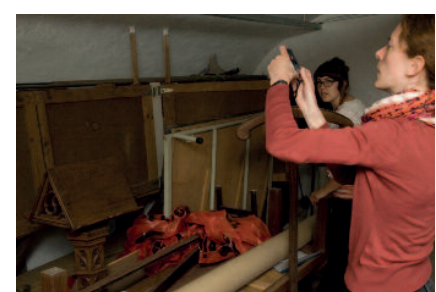
Een inventarisator aan het werk. [CRKC]