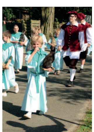
De vzw Hegge Poederlee is bezig met de volledige inventarisatie van het processiemateriaal.