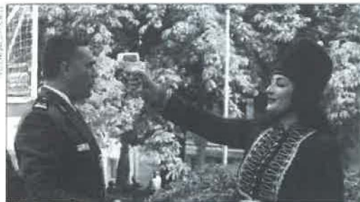
ZBOG KORONE Na trkalištu se mjerila tjelesna temperatura, a nakon natjecanja nije predviđena Večer slavodobitnika