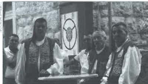
TRADICIA Ove godine se Alka održava u posebnim uvjetima. No, zar bi ih bilo 305, da se Sinjani nisu znali oduprati nedaćama