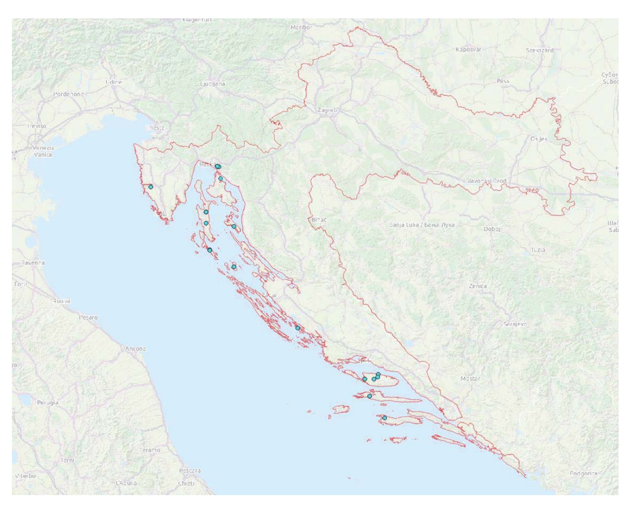
Geographical distribution of the communities concerned that contributed a consent letter