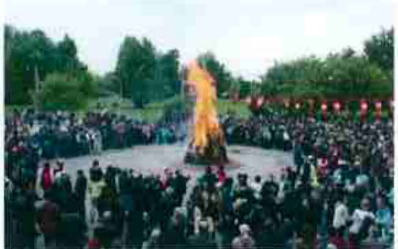
3 0 MARS 201 Le