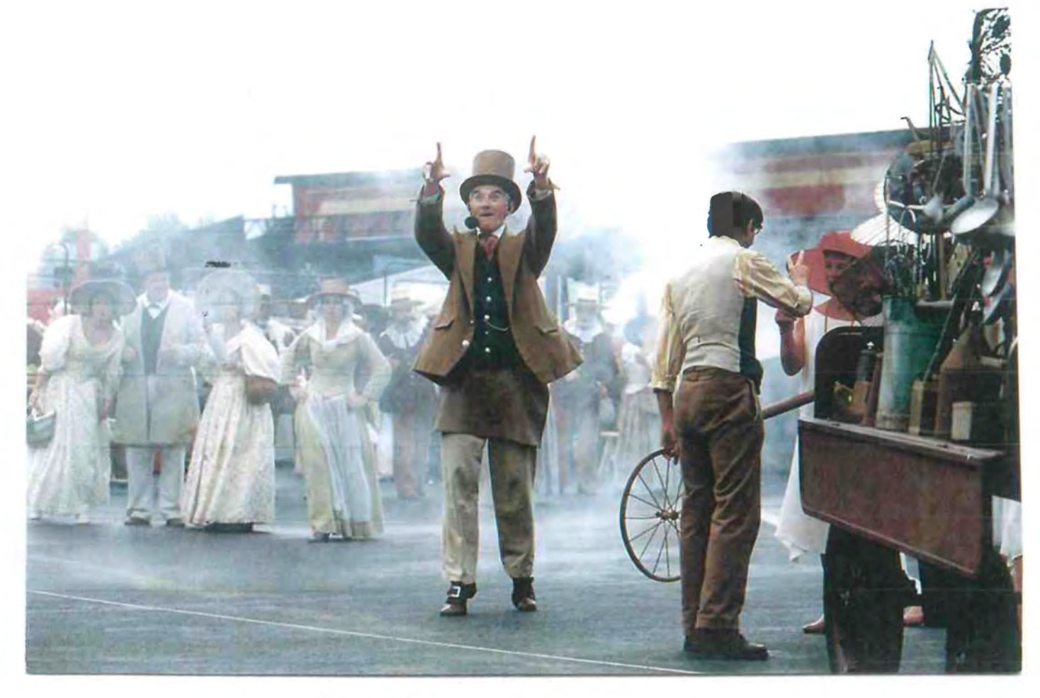
Chauds les marrons Vignerons et tacherons Chauds les aimeront. Chauds les marrons!