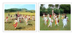
Peoples' palying who wearing hat with long String