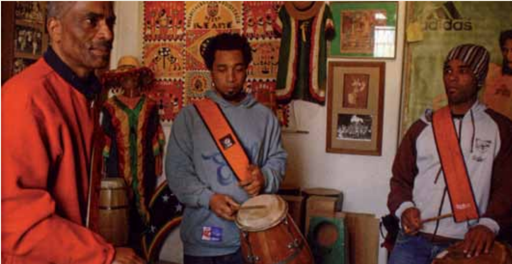
Ta'ãnga © UNESCO

Arateĩ ha péicha arete jave umi tambor de candombe ipujoa barrio del Sur Montevideo ryepyépe, ha mokõi barrio opytáva Uruguái Tavusúpe, hérava Palermo ha Cordón, oikohápe heta tapicha Africaygua ñemoñare. Oñepyrũ mboyve oñembohysýi ha oñembopu umi candombe, tapichakuéra oko'íva oñembyaty tata jerére ombojojávo hembiporu ha upekuévo ovy'a ojoapytépe.