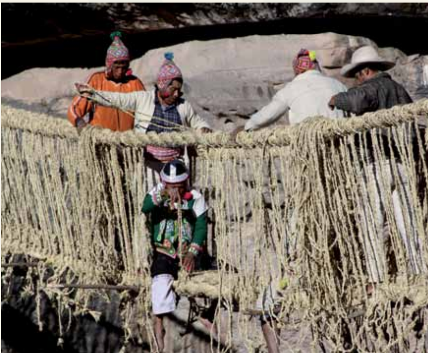
Ta'ãnga © UNESCO