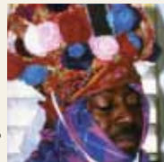
Ta'anga © UNESCO

Garifuna-kuéra rekópe tuicha mba'eterei gueteri ko'ã teko'yma orekóva hikuái ; umi karai tuja hína oñangarekóva imbarete ha'gua ko'ã ñembo'e ha vy'aguasu yma oñembohasáva ayvu rupi.