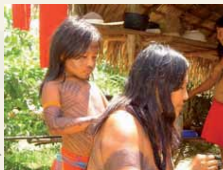
Ta'anga © UNESCO