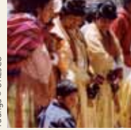
Ta'ãnga © UNESCO

Ojeporavopyre 2009-pe tembiapokue tekopy ojepokokuaa'ỹva rehegua iporãvévaramo