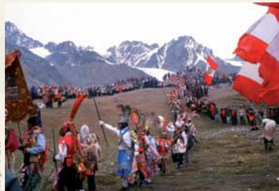
Ta'ãnga © UNESCO