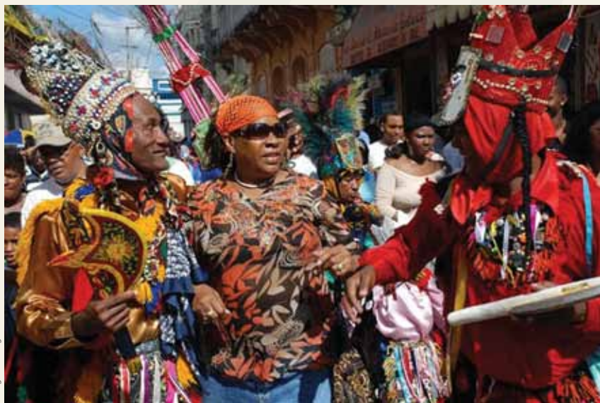
Ta'ãnga © Diego Félix

Cocolo ñoha'ãnga jeroky heñói siglo XIX mbyte rupi mba'apoharakuéra oñe'eva oupyre Karive guio ha opyta República Dominicana-pe. Pe komunida iñambuéva iñe'ẽ ha heko rupi omoheñói itupão, imbo'ehao ha joaju oñopytyvõ haña hikuái imba'ekueraitéva. Ñoha'ãnga jeroky ymavéva omopetei chupekuéra mamove ndojehecháigui ã mba'e. Ñepyryrã ko ñoha'ãnga oñemomirĩ ha oiko tembejugarúpe ; pe ñe'ẽ "cocolo" ohero umi ova pyahúva omba'apóva inglaterraygua takuare'ëndýpe upe ypa'úme ; katu ko'áña guarã opavave oguerovy'a ha ijaguara hese.