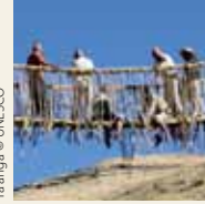
Ta'ãnga © UNESCO