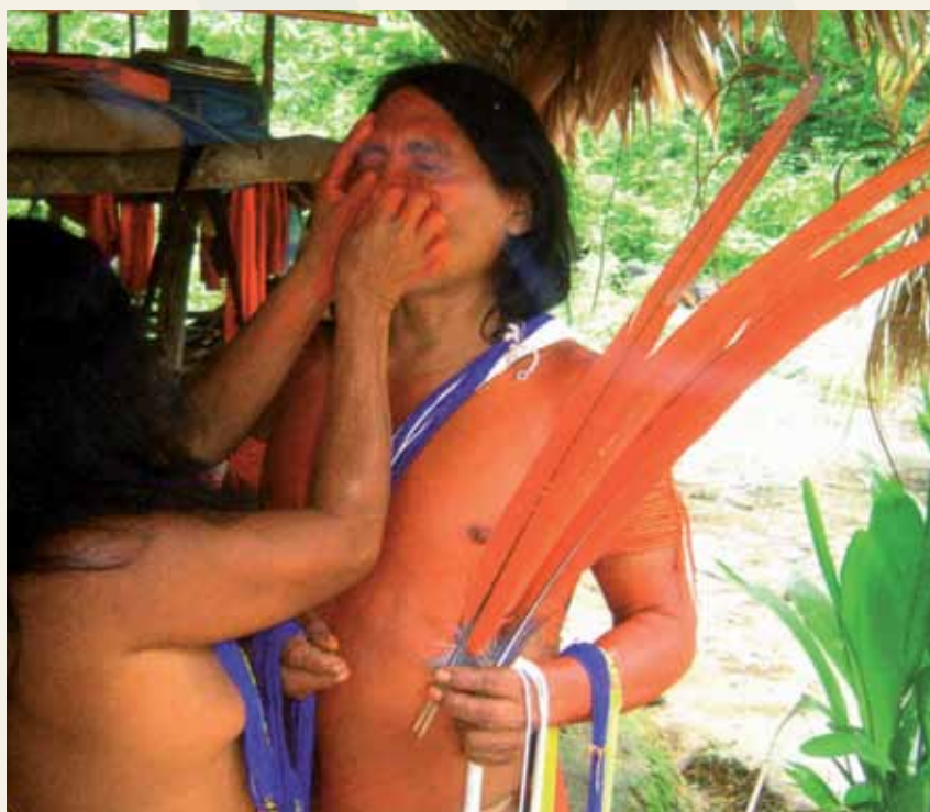
Ta'anga © UNESCO

Ymaite guive komunida wajapis opytáva yvatévo Amazonia-pe ombosako'i yvyra rykue isa'yhetáva oiporúva ombojeguasa'ipa hağua hete. Omoha'anga hikuái jaguarete, mbói guasu, panambi ha pira hamba'e omyasáivo ijeroviapy arapy reñói rehegua ombohasáva hikuái ayvu rupi ymaite guive