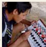
Ta'anga © UNESCO

Umi kusiwas ta'anga ogueromandu'a yvypóra ñepyrũmby ha oñemyasái hetaitemi jeroviapy yvypóra ñepyrũmby rehegua rupive. Ta'anga oñembojegua hetekuéra rehe ojoguetaha ojopógui jeroviapy amerikaygua oñemyasái yma guive ayvu rupi rehe, ha hetaiterei mba'e umi tetã reko rehegua ohechauka, jámane jeiko ojoapytépe, teko rehegua, mba'eporã ha opaichagua jeroviapy. Añetehápe ningo kusiwa ohechauka umi wajapi reko tee, he'eséva ndopytái pe ta'angápe año, síno hetaireive mba'e oikuaakase. Ta'anga omoheñóiva hikuái hembikuaa yma rehegua katuínte oñembopyahu, umi moha'angahára indígena ombopyahumemégui hembiapokuéra.