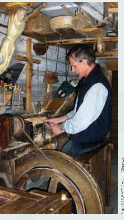
🛯 (Lituania) chakanaka uñstayata ukhamaraki kunsa saña muni ukanaka

Convención ukana lista ukhamaraki phughata wakisiri phughaña amtanakapa Convención gillgata 17 amtachinunxa jank'aki tuwaqaña jani uñjkaya jani llamkht'akaya yänakata Lista ("Lista de Salvaguardia Urgente") wakichayasa katuyañataki ghananchatawa. Yaqha listaxa, Lista Representativa del Patrimonio Cultural Inmaterial de la Humanidad ("Lista Representativa") satarakiwa, ukaxa jani uñjkaya jani llamkht'akaya yänakaxata yatiñataki yäqañatakiwa (16 Amtachinu).