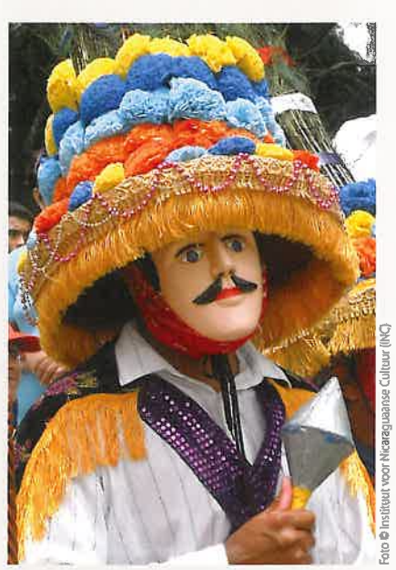
🙃 El Güegüense, Nicaragua