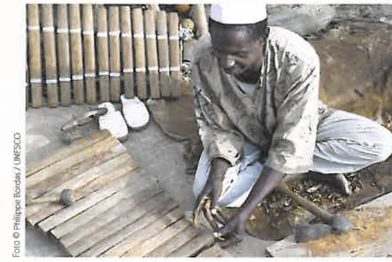
© De culturele ruimte van Sosso-Bala, Guinea